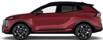
Magma Red (ARD) metallic Tak: Pearl Black (HBR)