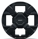
19" aluminiumfälg (Advance)