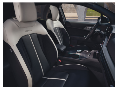
Mörk klädsel i mockaimitation samt konstläder, (GT Line)