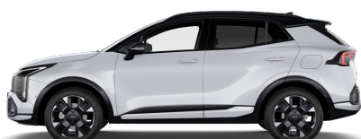
Deluxe White Pearl (HW2) metallic pearleffekt Tak: Pearl Black (HA2)