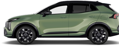
Experience Green (EXG) metallic Tak: Pearl Black (HBC)