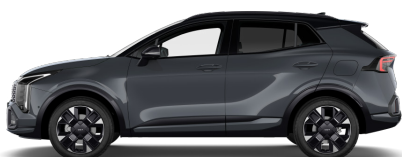
Penta Metal (H8G) metallic Tak: Pearl Black (HA6)