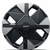
17" aluminiumfälg (Action)