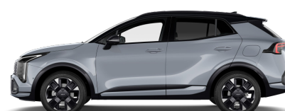
Lunar Silver (CSS) metallic Tak: Pearl Black (HA5)

Kia Sweden AB Kanalvägen 10A 194 61 Upplands Väsby Sverige Tfn: 08 - 400 443 00 www.kia.com