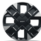
19" aluminiumfälg (GT Line)