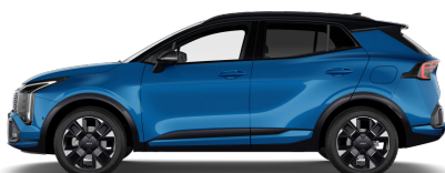
Blue Flame (B3L) metallic Tak: Pearl Black (HA8)