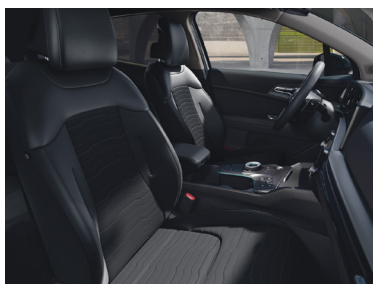
Mörk delläderklädsel (konstläder), (Advance)