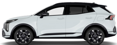
Casa White (WD) solid Tak: Pearl Black (HA3)