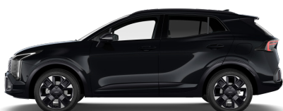
Pearl Black (1K) metallic pearleffekt