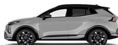
Wolf Gray (WAF) metallic Tak: Pearl Black (HBM)