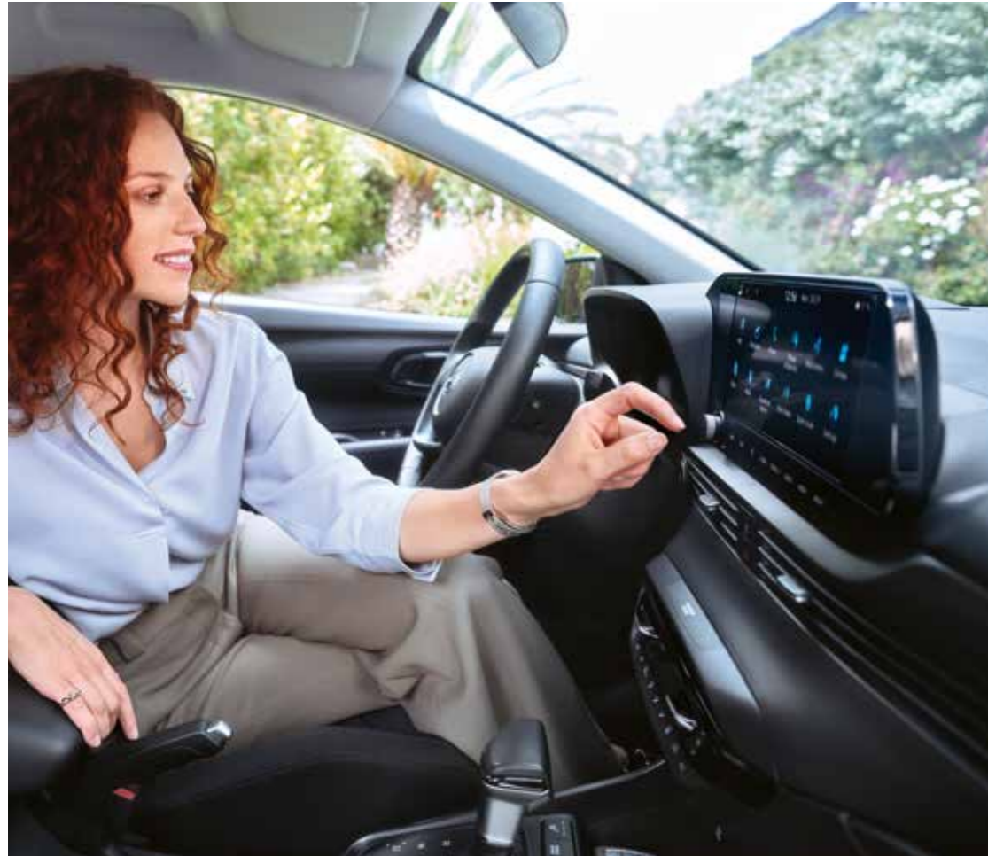
Med stöd för Apple CarPlay™ och Android Auto™ kan du spegla appar, musik och telefonlayout direkt på den stora skärmen.*

Njut av toppmodern uppkoppling och dubbla 10,25-tums skärmar med split screen-funktion. Tack vare Over The Air-uppdateringar (OTA), där du får tillgång till de senaste kartorna och funktionerna, har det avancerade infotainmentsystemet dessutom blivit ännu bättre.