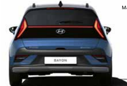
Spårvidd (16" / 17") 1 551 / 1 552