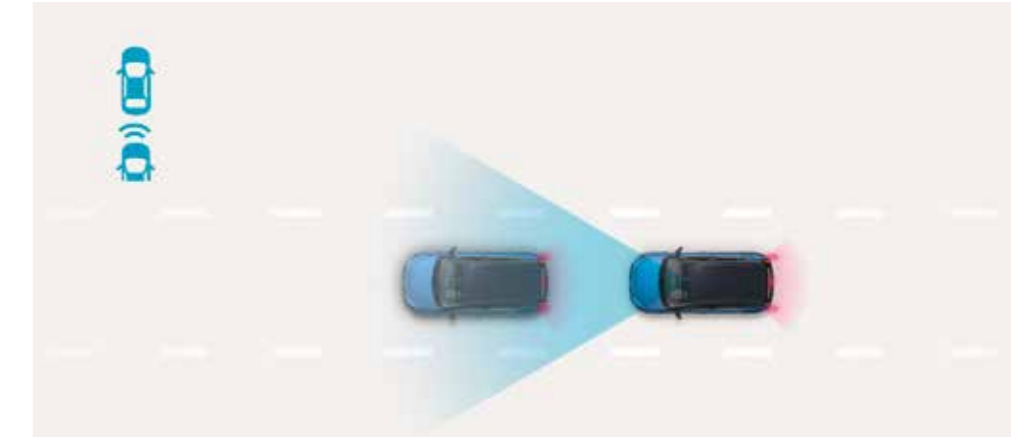
Forward Collision-avoidance Assist bromsar automatiskt om systemet upptäcker plötslig inbromsning från bilen framför, eller om det detekterar fotgängare och cyklister på vägen. ◊