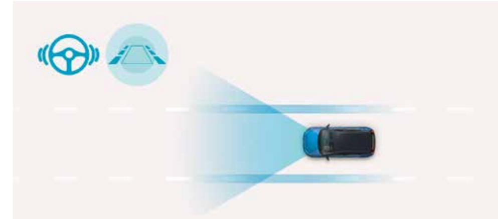
Med hjälp av små rörelser i ratten håller Lane Following Assist bilen centrerad i sin fil, vid hastigheter mellan 0 och 180 km/h på motorvägar och i stadstrafik. ◊

Avancerade förarassistanssystem och ett paket med en rad innovativa, ständigt aktiva säkerhetsfunktioner, gör dig ännu tryggare på vägen.