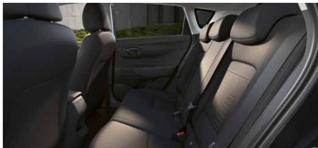
Gott om plats för benen och 411 liter bagageutrymme - BAYON utmärker sig i sitt segment med sin rymliga, eleganta interiör.