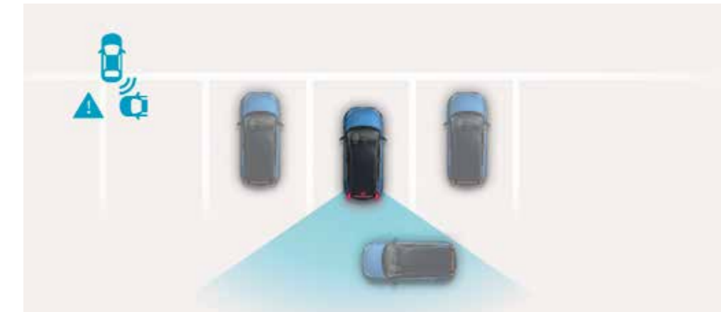
När du backar varnar Rear Cross-traffic Collision-avoidance Assist dig om fordon närmar sig från sidan. Systemet bromsar också automatiskt. ◊