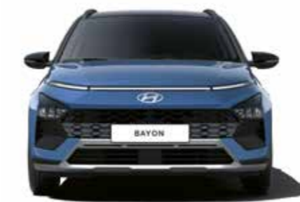
Bredd 1 775 Spårvidd (16" / 17") 1 775 / 1 546