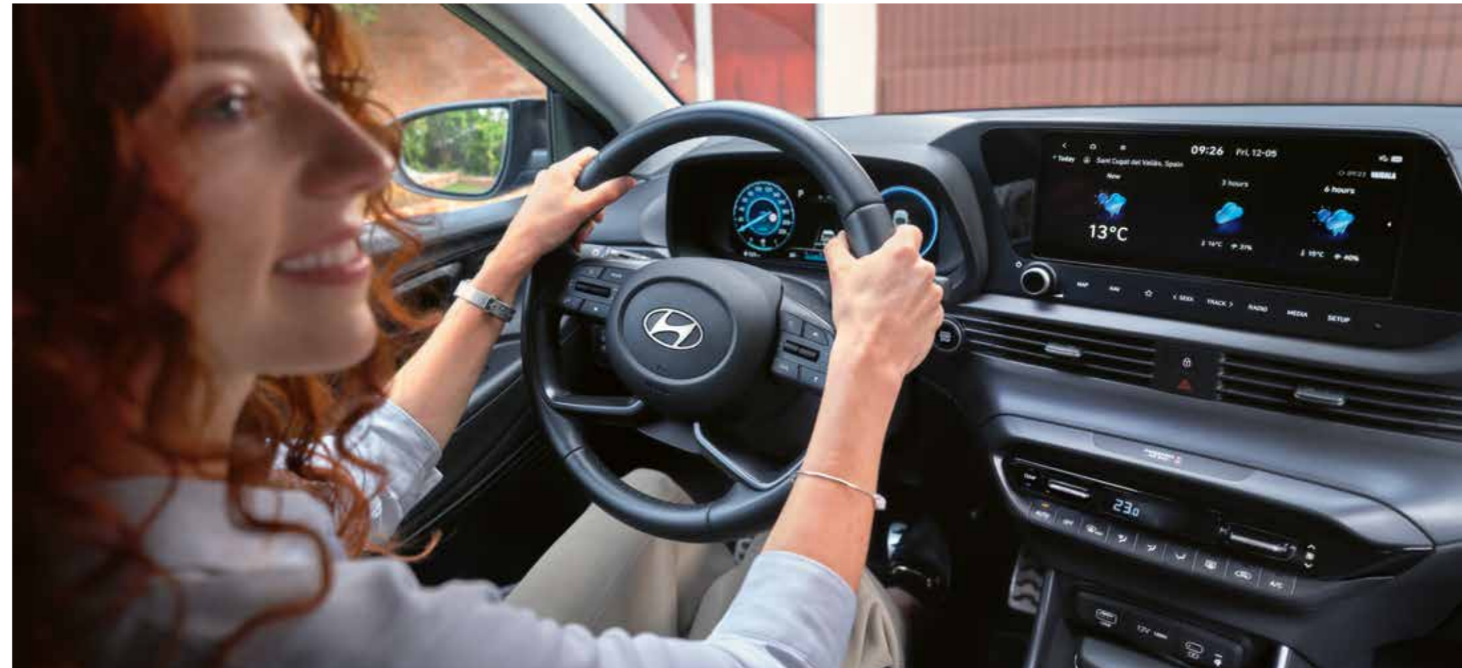
Ladda din smartphone snabbt och enkelt, med hjälp av det trådlösa laddningsfacket i mittkonsolen eller med USB-C-portarna fram och bak.