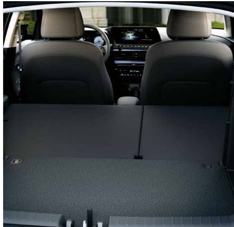
BAYON har både komforten och lastutrymmet hos en SUV. Med 60:40 fällbara baksäten får du dessutom flexibiliteten att även lasta större, otympliga saker.