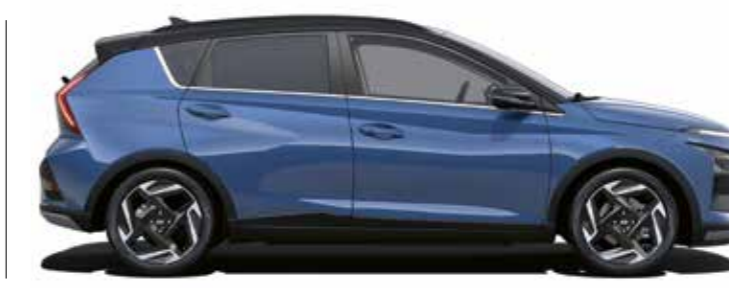
Längd 4 180 Axelavstånd 2 580