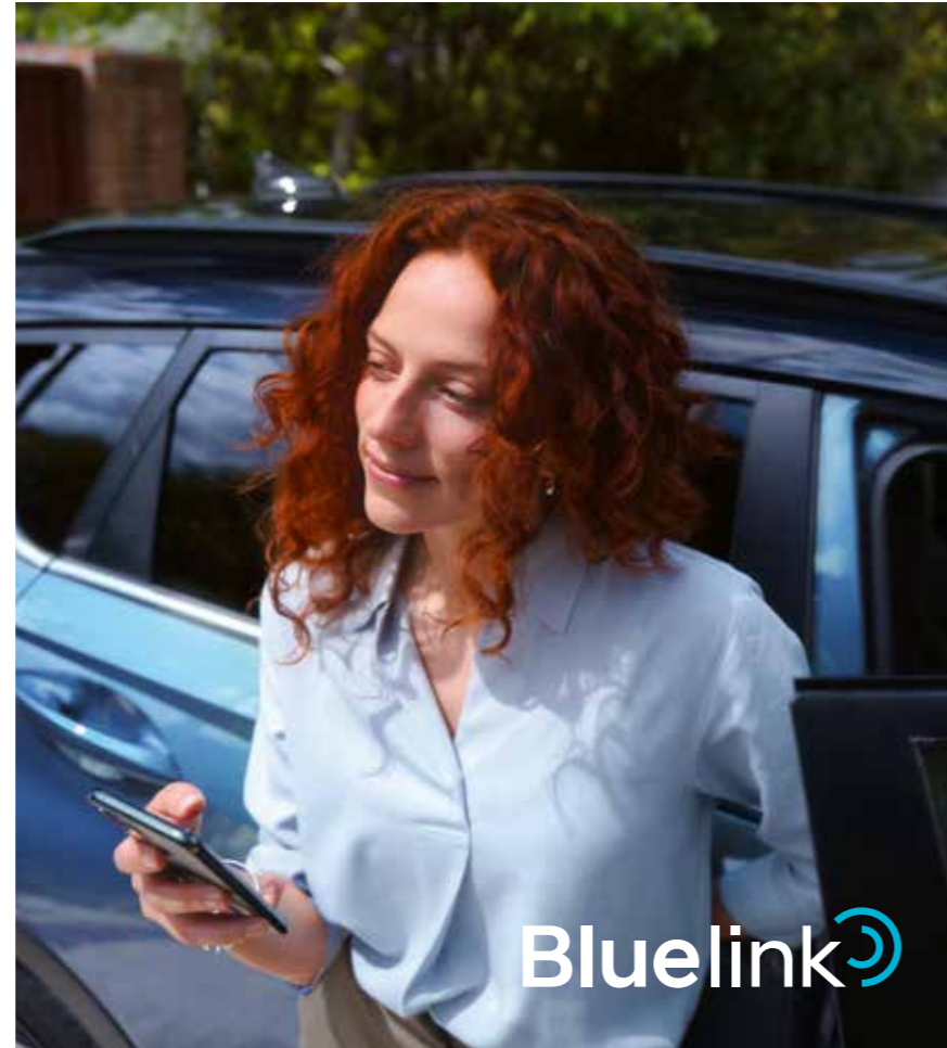
BAYON är utrustad med Bluelink Connected Car Services, för sömlös uppkoppling via din smartphone eller den centrerade 10,25-tums pekskärmen.